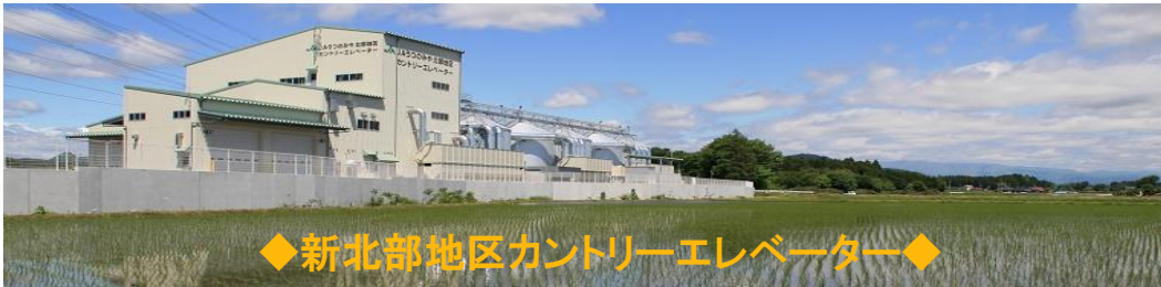
◆ 新北部地区カントリーエレベーター ◆

また管内は環境に配慮した「こだわり米」の作付けを推進しており、24年産米では新設した北部地区カントリーエレベーターで「特別栽培米」の施設荷受けを予定しています。これまで管内南部地区の南河内ライスセンターにおいて「特別栽培米」の施設荷受けをしていましたが、2基目の「特別栽培米」の荷受施設として、また北部地区の中核的役割を担う施設として、卸の皆様にも良品質米を提供できるよう期待するところであります。