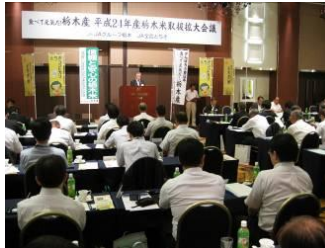
(副会長による決議)