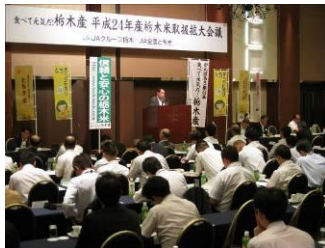
(県本部長によるまとめ)