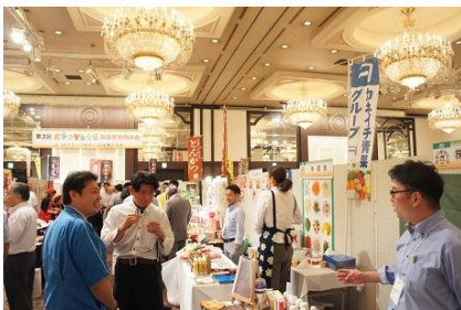
試食なども行われた出展ブース

『とちぎの農畜産物』を紹介する商談会も 今回で3回目の開催となり、大盛況のうちに終了しました！