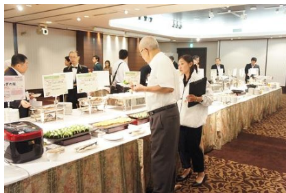
とちぎ県産品を使用した料理の試食ブース