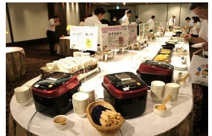
試食ブースにはとちぎ米を提供しました！