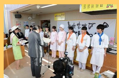
受賞者それぞれが表彰されました