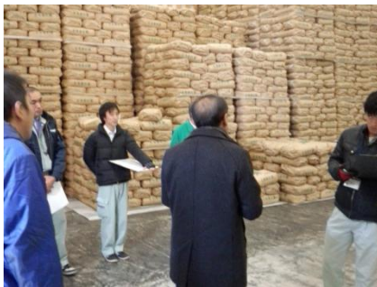
清掃状況・管理器具の整備等をチェック