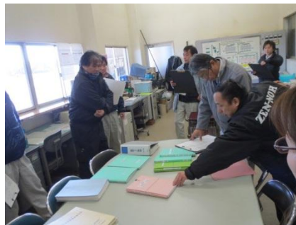
施設内の各種帳票類の確認