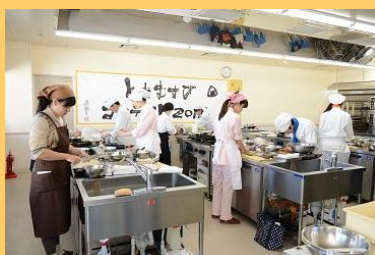
コンテスト当日の調理風景

今回も、『とちぎ米』と『栃木県産農畜産物』を使用した、アイデアあふれるとちむすびが揃いました。