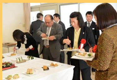
二次審査対象の10作品の試食